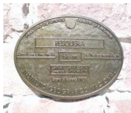
Imagen de la Placa

La placa está situada en la fachada principal del Ayuntamiento. (Ver alzado).